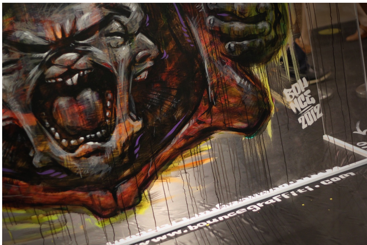
2012 BOUNCE 信義誠品 現場創作