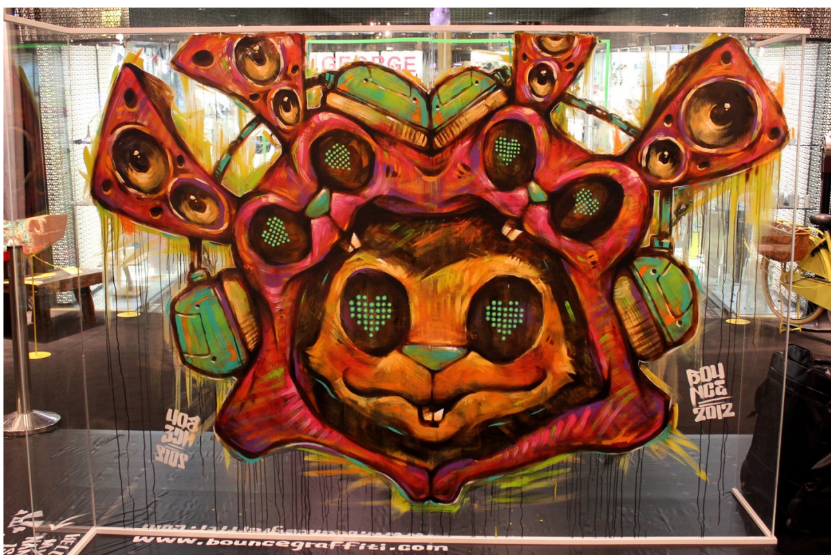
2012 BOUNCE 信義誠品 現場創作